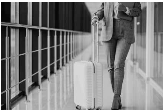
Τα μέσα μαζικής μεταφοράς αποτελούν επίσης σημαντικό κριτήριο για τη βιωσιμότητα των εκδηλώσεων.

κοινό που απαιτεί μια ήρεμη και γαλήνια ατμόσφαιρα, δεν έχει νόημα να αναζητήσετε χώρους κοντά σε ένα μεγάλο αεροδρόμιο, όσο βολικό κι αν είναι. Αντιθέτως, πρέπει να αναζητήσετε χώρους μακριά από την κίνηση και τον θόρυβο, όπου οι συμμετέχοντες μπορούν να περιπλανηθούν ανενόχλητοι. Η κατανόηση του σκοπού της εκδήλωσης είναι ζωτικής σημασίας ακόμη και σε αυτό το σημείο. Βεβαιω-